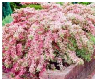
Вейгела цветущая Санни Принцесс