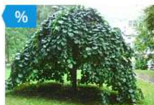
Вяз 'Camperdownii' -